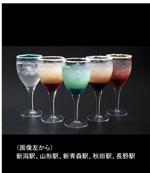
(画像左から) 新潟駅、山形駅、新青森駅、秋田駅、長野駅