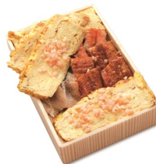
◀2017年駅弁大將軍▶ えび千両ちらし