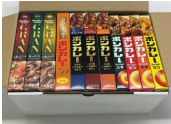
ボンカレー詰め合わせセット 30名さま

10月9日(火)から10月22日(月)の期間中、NewDays 公式 Twitter アカウント「NewDays (@newdays_jp)」をフォローし、対象のキャンペーン告知ツイートをリツイートしていただくと、抽選で「ボンカレー詰め合わせセット」を30名さま、「ボンカレーオリジナルTシャツ」を20名さまにプレゼントします。